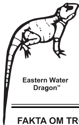
Eastern Water Dragon