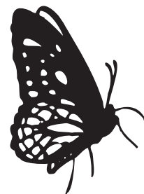
Cairns Birdwing Butterfly